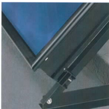
Montage en terrasse