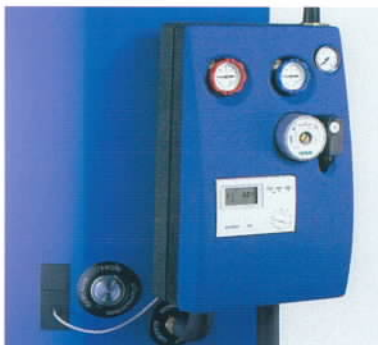
Station solaire complète