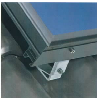
Montage en appui sur la toiture

Schüco SCS : BP3 - 78612 Le Perray-en-Yvelines cedex Tél. : 01 34 84 22 00 Fax : 01 34 84 24 07 www.schuco.fr