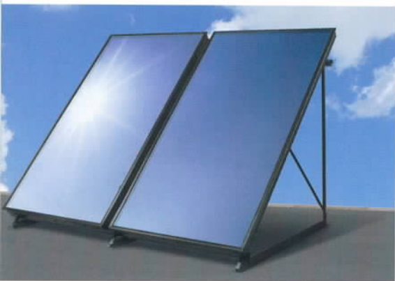
Une fixation simple et sûre sur le corps du bâtiment